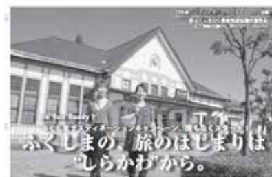
ふくしまの、旅のはじまりは しらかわから。

自然・景観や郷土料理・ご当地グルメなど観光資源と云われるものはたくさんありますが、その土地ならではのおもてなし手法やその“人”こそが、最も魅力的な観光資源になる日もそう遠くないのではないのでしょうか。(野中)